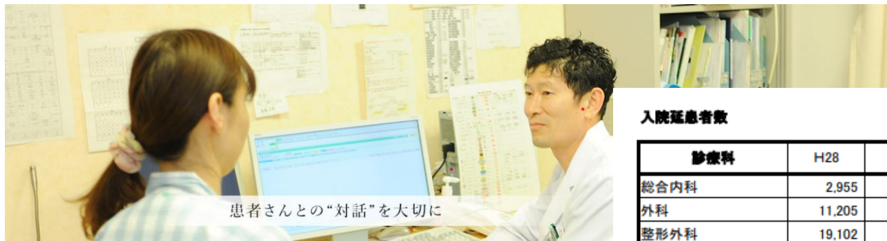
患者さんとの“対話”を大切に